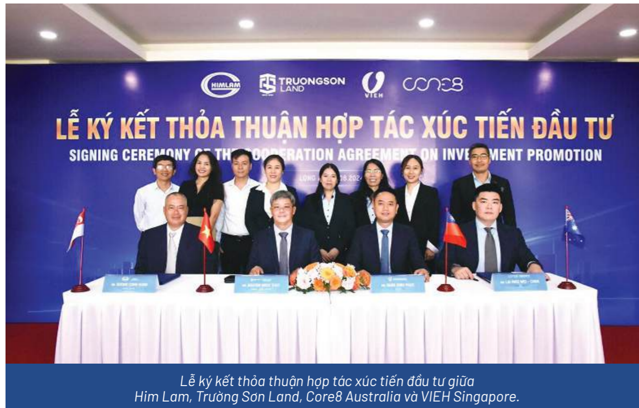
Lễ ký kết thỏa thuận hợp tác xúc tiến đầu tư giữa Him Lam, Trường Sơn Land, Core8 Australia và VIEH Singapore.

Vừa qua, Him Lam, Trường Sơn Land, Core8 Australia và VIEH Singapore đã ký kết thỏa thuận hợp tác xúc tiến đầu tư tại khu công nghiệp Đức Hòa 3 (tỉnh Long An).