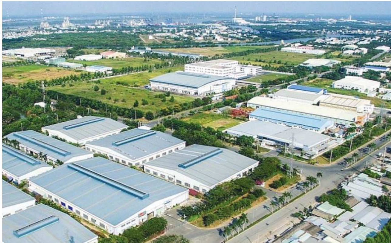
Các khu công nghiệp tại Việt Nam đã thu hút khoảng 15,2 tỷ USD trong nửa đầu năm nay (tăng 13,1% so với cùng kỳ)

Tại Bình Dương, đến cuối tháng 7, lượng vốn FDI trong các khu công nghiệp đã thu hút đạt mức 825 triệu USD. Lũy kế 7 tháng đầu năm nay, tỉnh này có hơn 4.300 dự án FDI từ