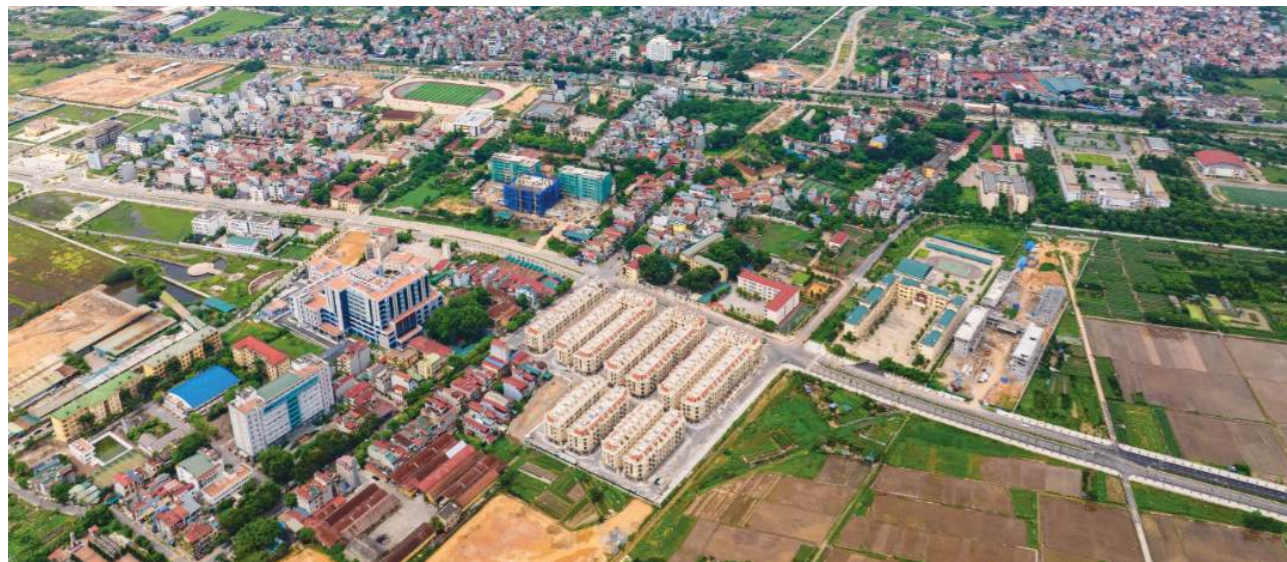
Thị trường bất động sản Thường Tín hưởng lợi từ các trục giao thông trọng điểm.

Sau phân khúc căn hộ chung cư tại thị trường Hà Nội, biệt thự và liền kề đang là phân khúc được chú ý nhiều nhất. Với nguồn cung mới dự kiến khan hiếm từ nay đến cuối năm, đây sẽ tiếp tục là phân khúc thị trường gây sức hút mạnh mẽ tại Thủ đô.