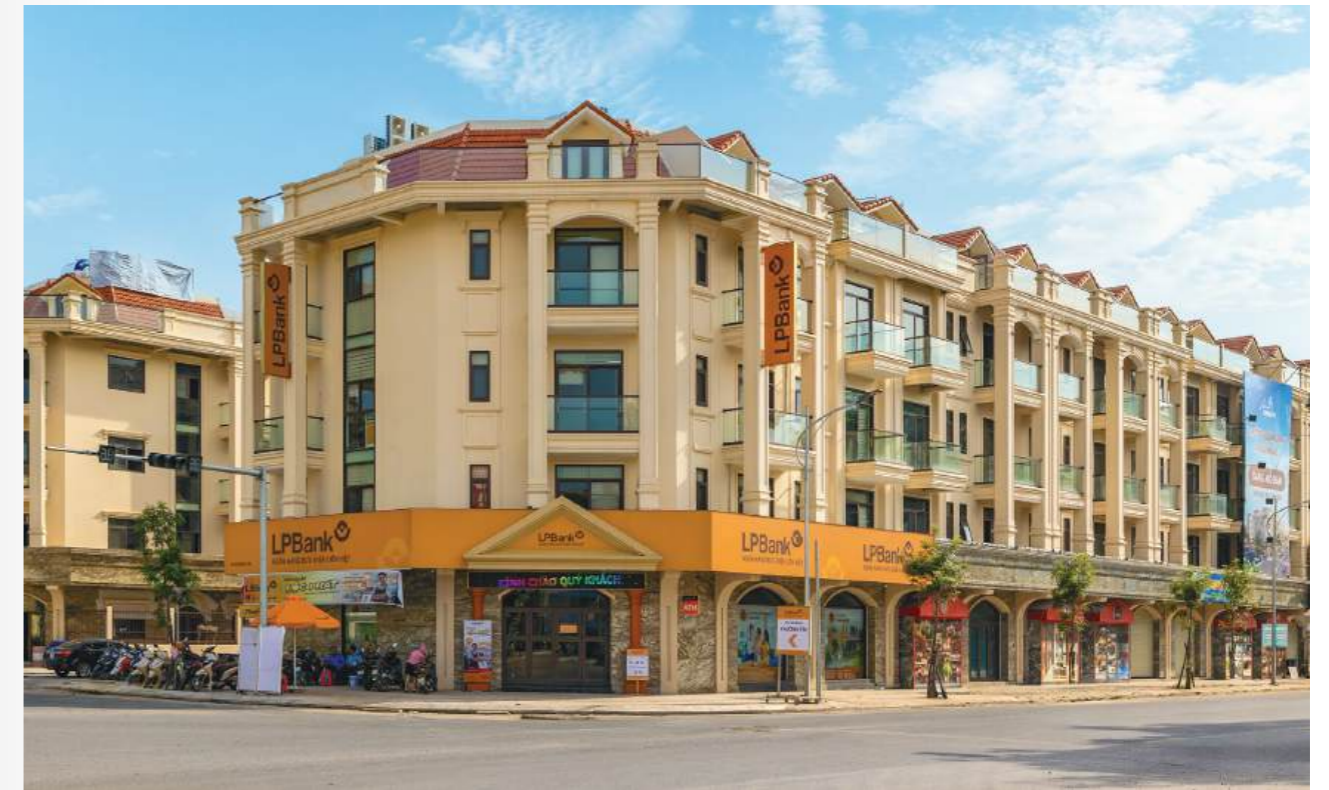
Him Lam Thường Tín kỳ vọng sẽ thay đổi diện mạo khu vực cửa ngõ phía Nam thủ đô

Đặc biệt, sự gia tăng dân số nhanh, cùng sự phát triển của các cụm công nghiệp và làng nghề truyền thống tại Thường Tín cũng tạo tiền đề cho cộng đồng cư dân tinh hoa của Him Lam Thường Tín có thể khai thác kinh doanh bền vững. Sau khi đi vào hoạt động, phố thương mại Him Lam Thường Tín hứa hẹn sẽ thay đổi diện mạo, kích cầu nền kinh tế và “đánh thức” tiềm năng bất động sản làng nghề tại khu vực vốn giàu giá trị truyền thống, văn hóa như Thường Tín.