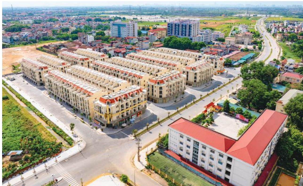
Thường Tín hưởng lợi từ mảnh đất tinh hoa văn hóa làng nghề

Tọa lạc ngay trung tâm hành chính mới của huyện Thường Tín, Him Lam Thường Tín được thừa hưởng cơ sở hạ tầng phát triển đồng bộ với hàng loạt tuyến giao thông huyết mạch như: QL1A, cao tốc Pháp Vân,