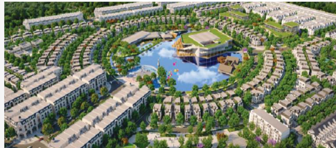
Phân khúc nhà ở thấp tầng tại Hà Nội ngày càng "tăng nhiệt"