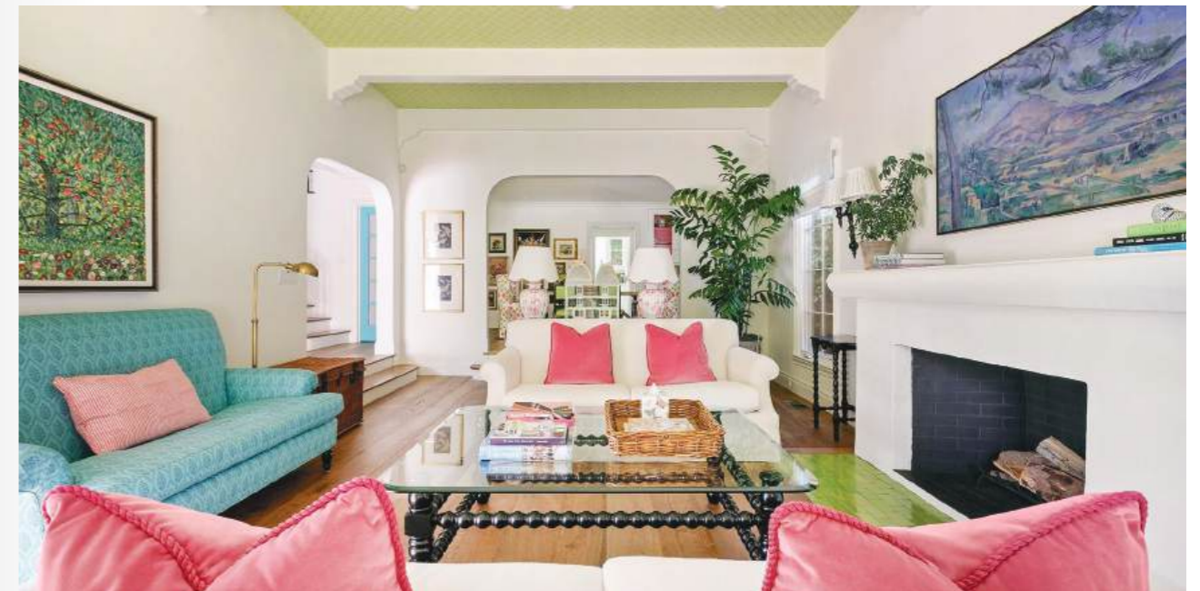
Ngôi nhà của nữ diễn viên Emma Stone

Điều này giống với căn nhà của nữ diễn viên Emma Stone. Được biết, gần đây bà đã rao bán bất động sản trị giá 4 triệu USD. Cách phối màu trong căn biệt thự từ những bức tường màu bạc hà kết hợp với đồ nội thất màu ngọc lam, thêm một chút điểm nhấn màu hồng pastel để phối màu với những đồ nội thất bằng gỗ trắng. Khi chúng kết hợp lại với nhau khiến căn nhà trở nên sang trọng nhưng không kém phần ngọt ngào.