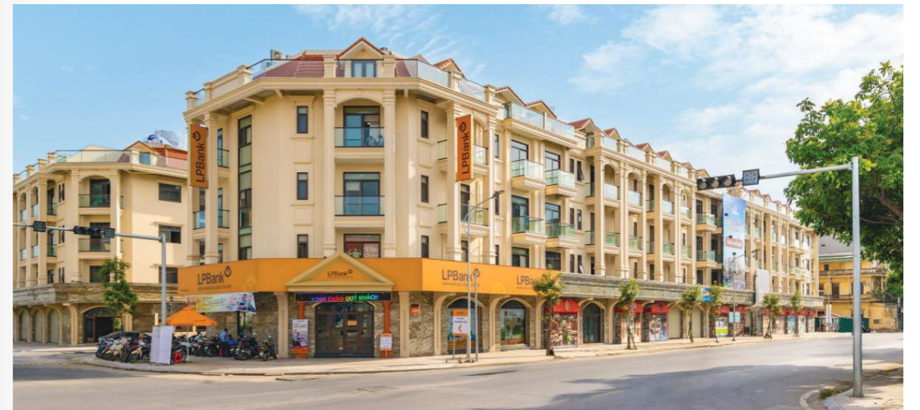
Tín chỉ carbon: Nhiều doanh nghiệp cố tình hiểu sai, làm nhiều thông tin

"Nhóm nhà đầu tư tại Hà Nội là số một cả nước cả về số lượng, độ nhanh nhạy về thông tin và am hiểu thị trường. Sau thời gian dài đi đầu tư khắp cả nước, thời gian gần đây, họ đang rút về Hà Nội để tìm kiếm cơ hội. Việc nhóm các nhà đầu tư mua đi