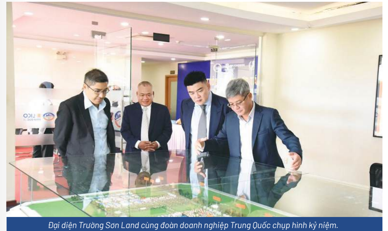
Đại diện Trường Sơn Land cùng đoàn doanh nghiệp Trung Quốc chụp hình kỷ niệm.

Tại buổi lễ, đại diện Him Lam, Trường Sơn Land, Core8 Australia và VIEH Singapore đều bày tỏ sự tin tưởng, đánh giá cao về mối quan hệ hợp tác bền chặt thông qua những mục tiêu chung và định hướng phát triển trong tương lai. Trọng tâm của liên minh chiến lược này là tầm nhìn chung về việc tạo ra một hệ sinh thái năng động thúc đẩy sự đổi mới, hợp tác và tăng trưởng bền vững trong ngành công nghiệp công nghệ cao, đặc biệt là công nghệ sinh học và công nghệ bán dẫn.