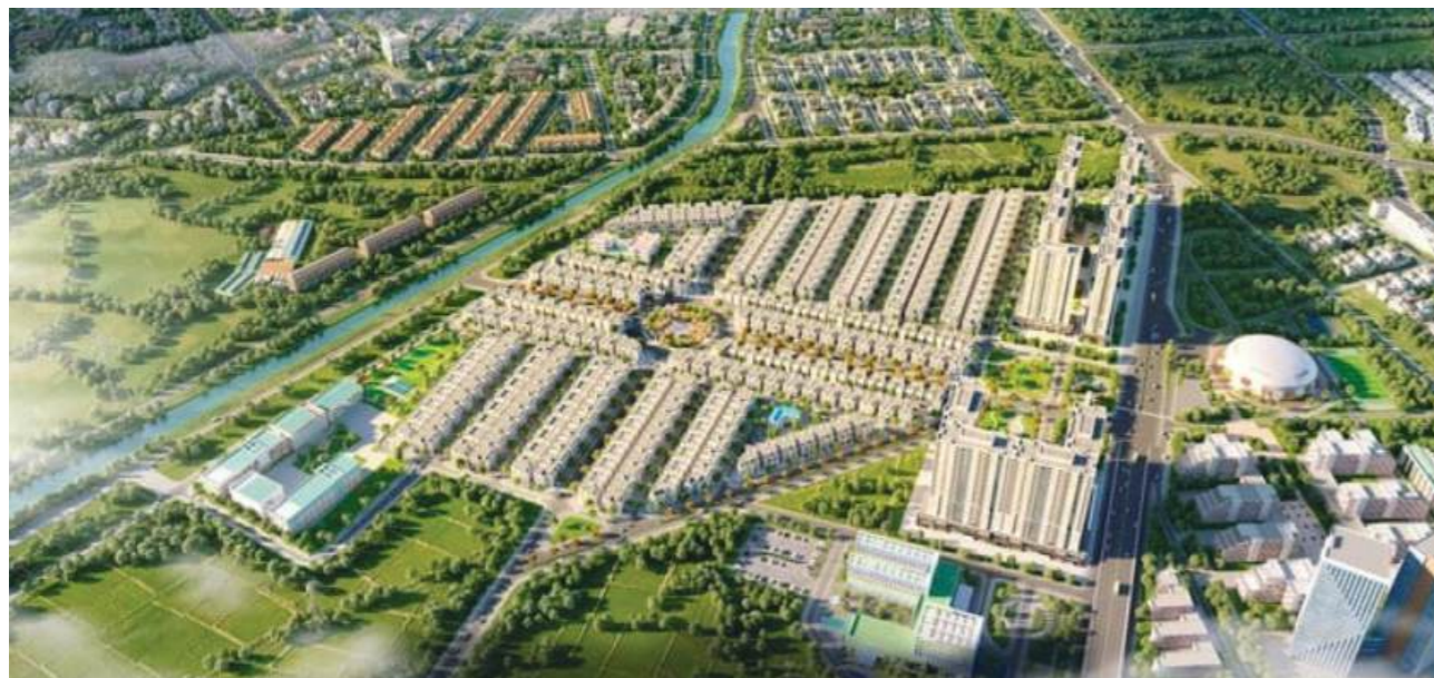
Phân khúc nhà ở thấp tầng tại Hà Nội ngày càng "tăng nhiệt"

Chính vì thế, việc nhóm các nhà đầu tư mua đi bán lại một lượng tiền lớn sẽ khiến cho thị trường BĐS tạo lập mặt bằng giá mới.